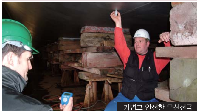
가볍고 안전한 무선전극

“와~전극 무게가 30g밖에 안되다니! 이젠 퇴근이 가볍겠네요 ^__^ ”